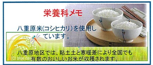
地元産食材の紹介カード