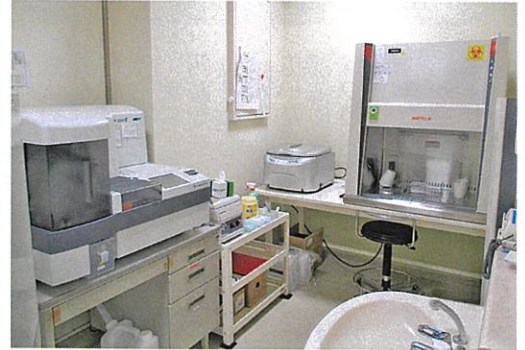
新型コロナウイルス抗原定量検査装置