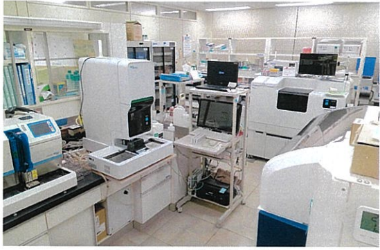
採血室側から見た検体検査室

令和4年度に行われた外部精度管理の二団体の評価調査において、当院は100点満点を獲得しました。これからも品質保証体制を強化し、迅速で精度の高い検査結果を提供してまいります。